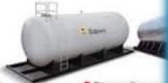
● Citerne d'eau pot industrielle et carbu