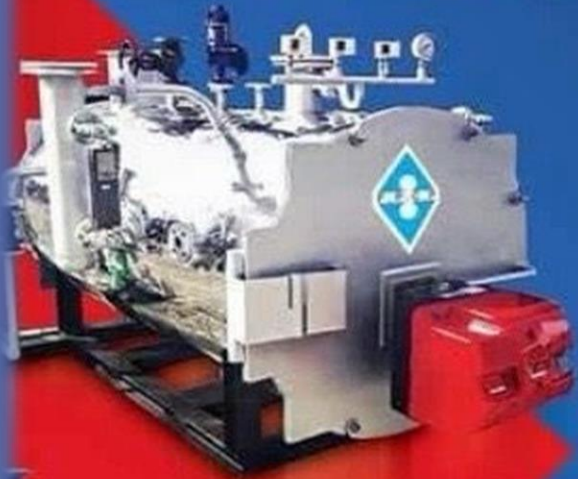
Chaudière à vapeur

ATION DE PRODUITS CHAUDRONNERIE & POLYETHYLENE