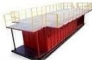
● Bac de stockage de boue de forage