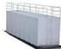
● Bac de stockage eau potable eau industrielle et carburant