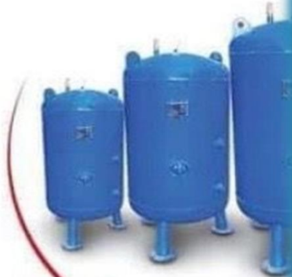
● Réservoir sous pression