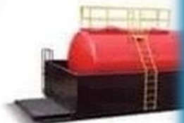
● Citerne à c industrielle et carbu